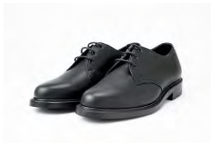
PORTER ¥49,400 (税込)