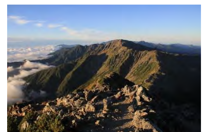
南アルプス白根三山 【北岳】1泊2日登山ツアー2名様 ¥56,800 (税込)