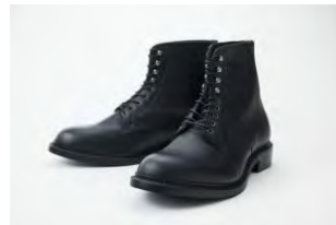
Variation2899 ¥60,050 (税込)