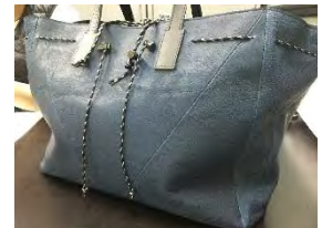
BOAT ¥60,450 (税込)