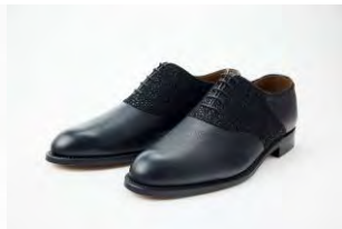
SADDLE ¥71,240 (税込)